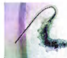
в) личинки мух-журчалок, «крыски»