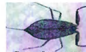
б) водный скорпион