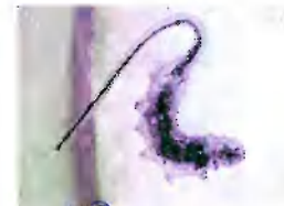
в) личинка мухи-журчалки, «крыски»