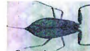
б) водный скорпион