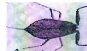
б) водный скорпион