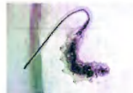
в) личинки мух-журчалок, «крыски»